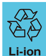
リチウムイオン電池